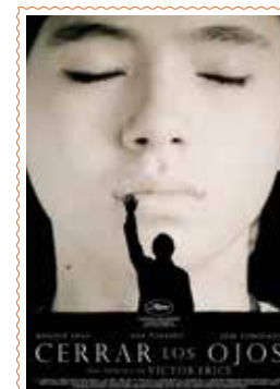
CERRAR LOS OJOS (+7 urte) 169'