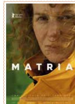
MATRIA (+12 urte) 99'