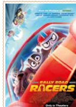
RALLY ROAD RACERS (Denak) 92'