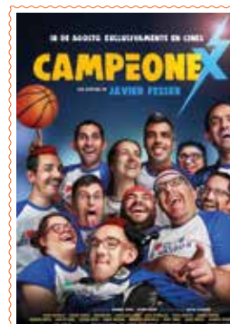
CAMPEONEX (Denak) 125'