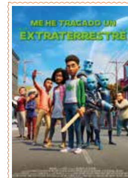
ME HE TRAGADO UN EXTRATERRESTRE (Denak) 85'