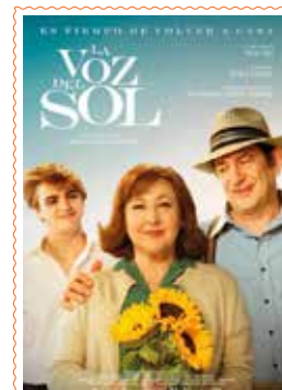
LA VOZ DEL SOL (+12 urte) 94'