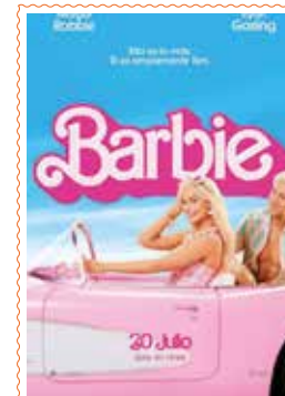
BARBIE (Denak) 113'