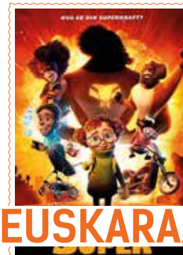
SUPERHEROIEN FAMILIA (Denak) 76'